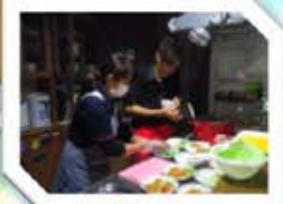
職員の手作りビーフシチュー