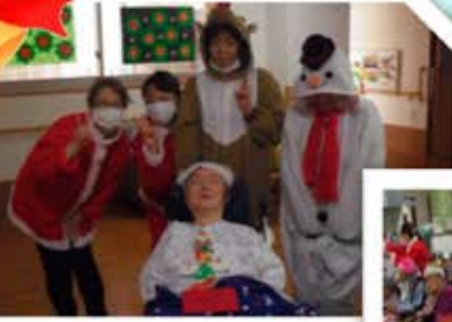
皆さんへ X'mas プレゼント