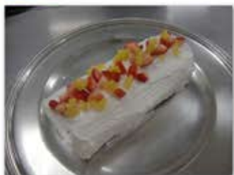
クリスマスロール