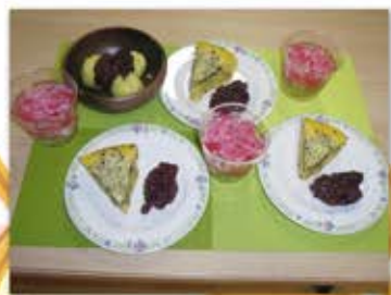
蒸しケーキ&茶巾団子