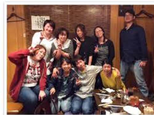
広報誌はこんな人達で作ってます。

〒208-0011 武蔵村山市学園2丁目37-5 TEL 042-590-0070 FAX 042-561-5881 http://www.kyoutokukai.com/