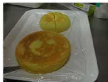
炊飯器チーズケーキ