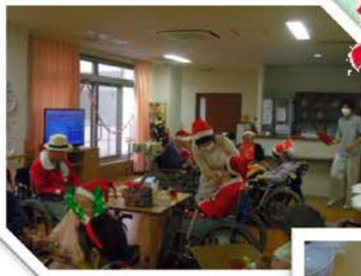
皆さんでケーキを作りました